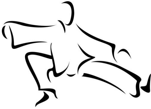
TAI CHI YANG